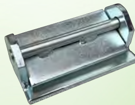
ホース用止水金具