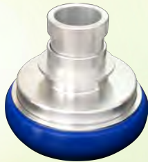
アルミ製 差込式メス65mm ×差込式オス40mm