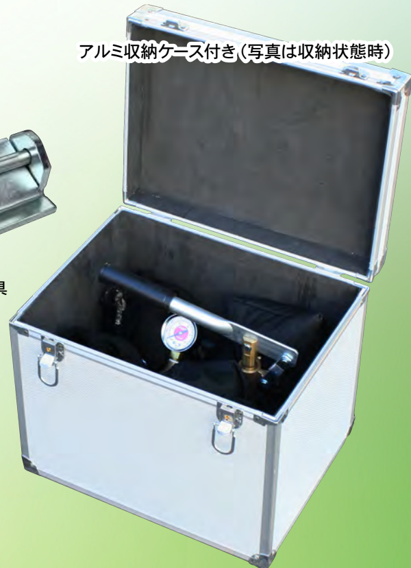
アルミ収納ケース付き(写真は収納状態時)