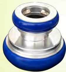
アルミ製 差込式メス65mm ×差込式メス65mm