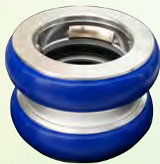
アルミ製 差込式メス65mm ×差込式メス40mm