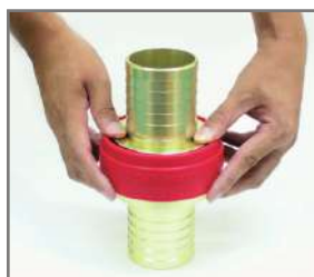
不意離脱防止タイヤ装着時