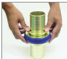
通常使用の町野式金具