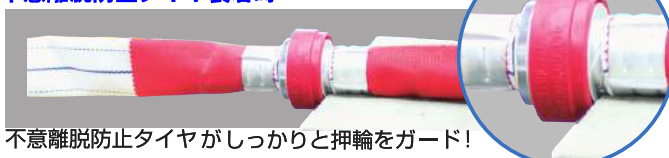
不意離脱防止タイヤがしっかりと押輪をガード!