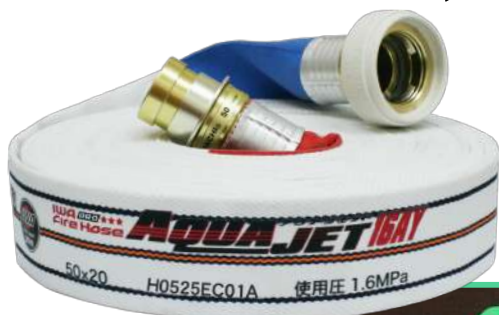
不意離脱防止タイヤ 装着例

なんとっ! 金具のタイヤを交換するだけ!! それだけで不意の離脱を大幅に低減できます。