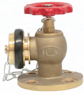
町野式キャップ・鎖付き