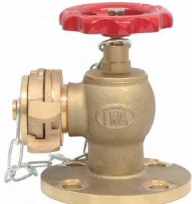
中島式キャップ・鎖付き