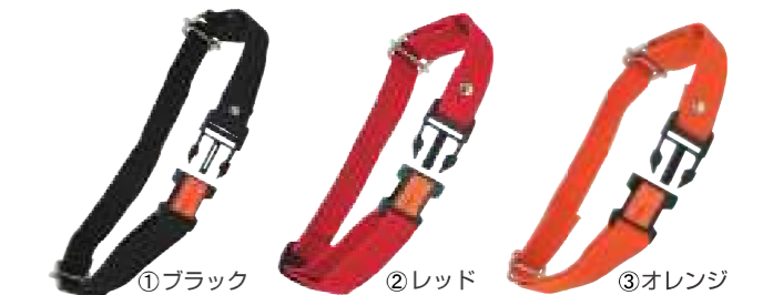
①ブラック ②レッド ③オレンジ