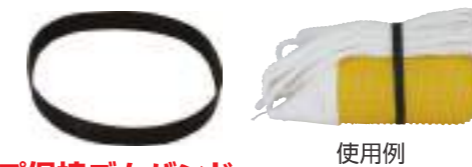
品番 内径 (mm) ゴム製 16RB00R 150