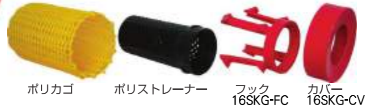
ポリカゴ ポリストレナー フック 16SKG-FC カバー 16SKG-CV

ちりよけカゴの常識を覆す カゴもロープも 取付け、 取り外しがとっても楽チン！ だから… 吸管から取り外して収納できる！