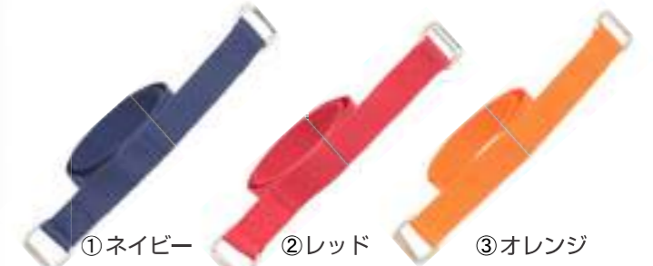
①ネイビー ②レッド ③オレンジ