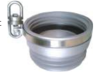
品番 サイズ アルミ製 16HIPOOA 75

吸管とストレナーの間に接続すれば、吸管ガイドロープが容易に 取付出来ます。非常にコンパクトに設計しております。