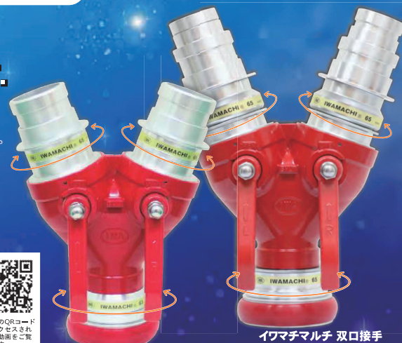
イワマチ 双口接手